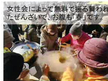
女性会によって無料で振る舞われたぜんざいで、お腹も「春」です。

皆さんでしっかりと活用いただき、地域活動が一層盛り上がることを祈念いたします。(中島地区社協 事務局)