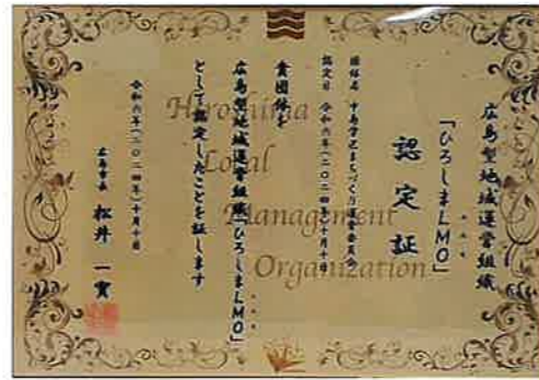
「なかじまLMO」が 広島市から認定 令和6年10月10日(木)