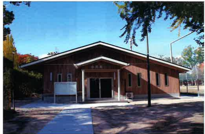
移転・新築が完了した 中島集会所での神事 令和6年12月16日(月)