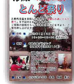
中島地区で 新聞折り込みした チラシ