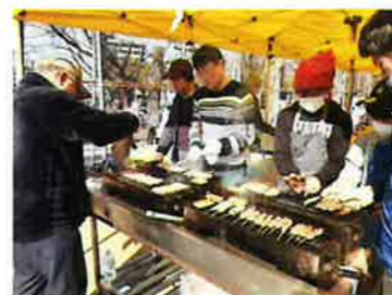
青少協の焼き鳥・フランクフルトでは、小学生もボランティアでお手伝い。