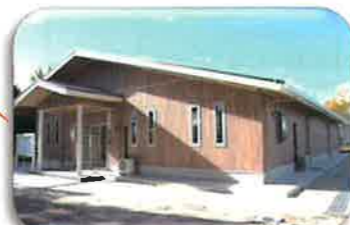
玄関は東の元安川に向き、朝から明るい日差しが入ります。