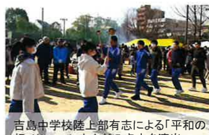
吉島中学校陸上部有志による「平和の灯」リレーで、とんどの点火を演出。