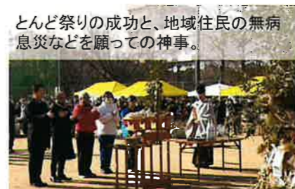
とんど祭りの成功と、地域住民の無病息災などを願っての神事。