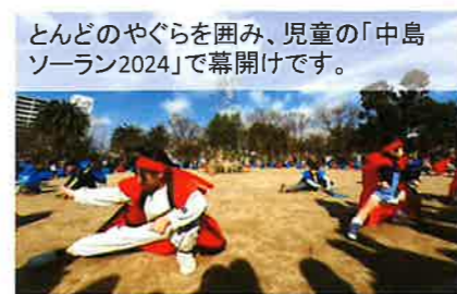
とんどのやぐらを囲み、児童の「中島ソーラン2024」で幕開けです。