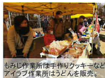
もみじ作業所は手作りクッキーなど、アイラブ作業所はうどんを販売。