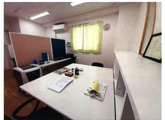
なかじまエルモの事務室は、中島集会所受付の北側の一室にあります。新年度の令和7年4月より、本格的に活動を始める予定です。

「なかじまエルモ」活動開始！ 中島地区の地域団体は「ひろしまLMO」に認定されました。 中島地区においても同様ですが、近年、少子高齢化や単身世帯の増加など社会の変化により、地域活動に参加する人も高齢化が進み、限られた人だけで活動している状況が顕著になっていきます。 このままでは、防犯、防災、地域のにぎわいづくりなどのさまざまな機能が低下してしまう可能性がります。 そこで、広島市は、地域に関わる地区社会福祉協議会や連合町内会・自治会などを中心に多様な主体(団体)が連携して、さまざまな地域課題の解決に取り組む「広島型地域運営組織「ひろしまLMO(エルモ)」」の設立・運営を推進し、市民が主体となるまちづくりを進めています。 中島地区社会福祉協議会においても、この取り組みに賛同し、関係する諸団体と連携して「中島学区まちづくり運営委員会」(通称「なかじまLMO」)を設立。令和6年10月10日(木)には広島市から認定を受け、活動を開始しました。 今後は、中島地区の地域団体に加えて、中島地区に根差した企業様などとも連携を進め、地域活動の担い手不足の解消と、継続可能な強固な組織作りを進めていきます。 中島地区にお住いの皆さまのご理解・ご協力ならびにご参加をお願いいたします。 (中島地区社協 事務局)