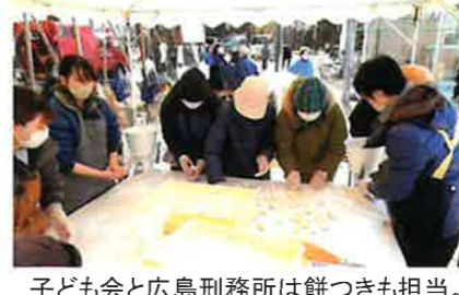
子ども会と広島刑務所は餅つきも担当。子どもたちも良い体験をしました。