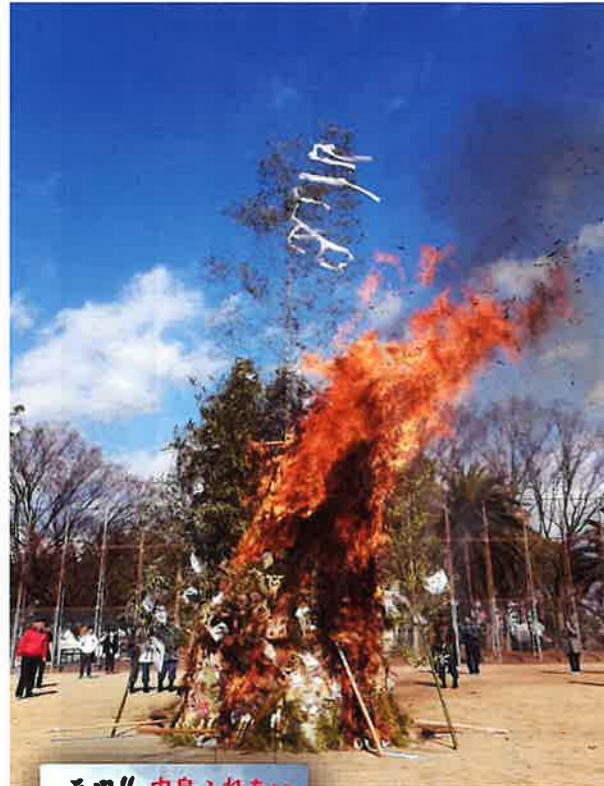
中島地区ふれあいとんと祭り 令和7年1月12日(日) 吉島公園にて