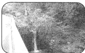
向原、豊栄の境あたり