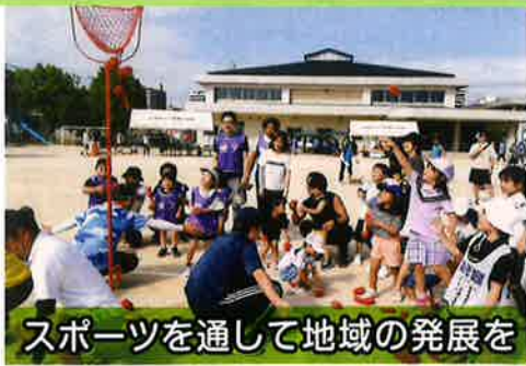
スポーツを通して地域の発展を

昨年も第59回宇品東地区町民大運動会が無事、開催されました。コロナ禍以前のように変わりなく生活できるようになった事で、地域住民の方たちが親睦と交流を深め一生懸命にスポーツをする姿や、子どもたちの笑い声が響くようこの運動会を通してより活気のある宇品東地区になったらと心から願います。そして地域の発展のため、スポーツを通して活動をしていきたいと思ひます。