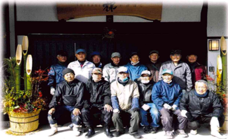
関川福寿会メンバー一同

高さ二メートルの竹を中心に、松や梅の枝を差し、縁起物の南天や葉ボタンを添えてボリューム満点の門松ができあがりました。関川福寿会のメンバー男性十五人で材料を採取。二十三日に竹を切りに行き、二十四日に設置準備、二十五日に飾り付けをしました。地域に根ざした行事として、今後も活動を続けてまいりたいと思います。