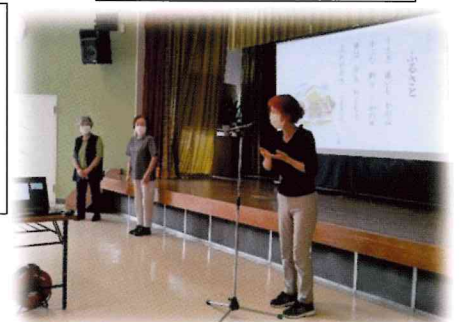
手話サークルさんと「故郷」を手話とともに歌いました