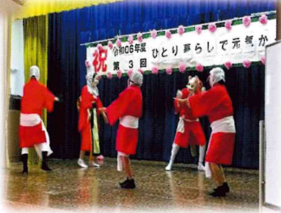
ひょっとこ踊り同好会

十二月十四日、ひとり暮らしの高齢者にお集まりいただき、「ひとり暮らしで元気か〜い!」を開催しました。民児協、女性会、白木地域包括支援センター、若武者など、たくさんの方の助けを借りて楽しい会にすることができました。またこの度は、三味線やサクソ演奏もあり、素敵なお時間を過ごすことができました。来年度もぜひご参加ください。