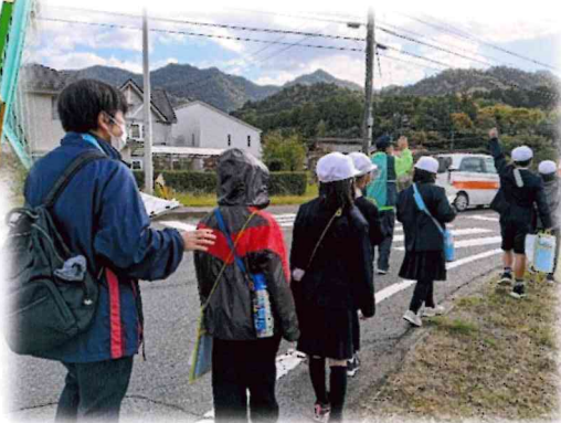
ちゃんと手を上げて渡りました。素晴らしい！