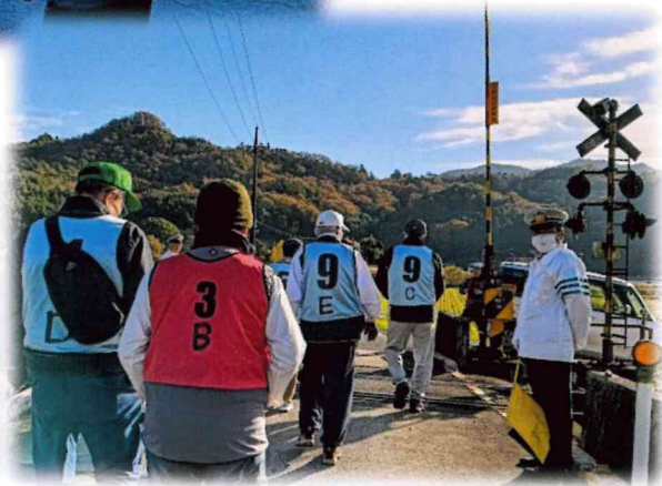
ウォーキング風景

距離がちょうどよかった方、歩きたらない方いろいろのようでした。これからも楽しい催しになるよう創意工夫いたしますので、ぜひご参加ください。