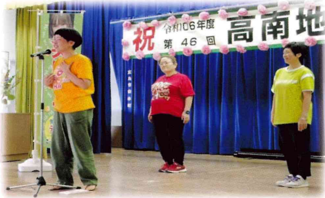
笑いヨガクラブ しらッキー♪の皆さん

第四六回 高南地区敬老会を開催いたしました。招待者・スタッフあわせて五三名となりました。規模は小さいけれど、笑いヨガで大きな笑いの渦に包まれました。また、この度の記念品は、高南地区で作られた2種類のジャムの詰め合わせになりました。喜んでいただけると幸いです。