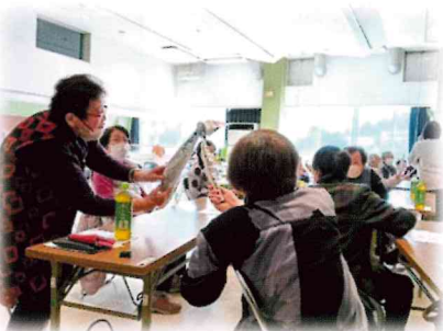
白木地域包括支援 センターによる楽 しいゲーム