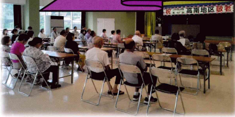
招待者の皆さん。おめでとうございます！