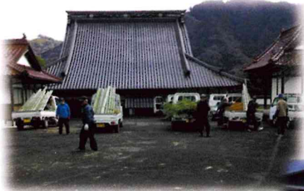
12月23日 竹の切り出し

十二月二十五日、白木町小越の白木の郷・ツジマチ・いづみ保育園・SHIRAKI 梯の玄関前に合計六対の門松の設置をいたしました。 新しい年の幸福を願い、毎年の関川福寿会恒例の行事となつて行っていますので、今年も力を合わせて行いました。作成した門松は、二〇二五年一月八日まで飾ります。