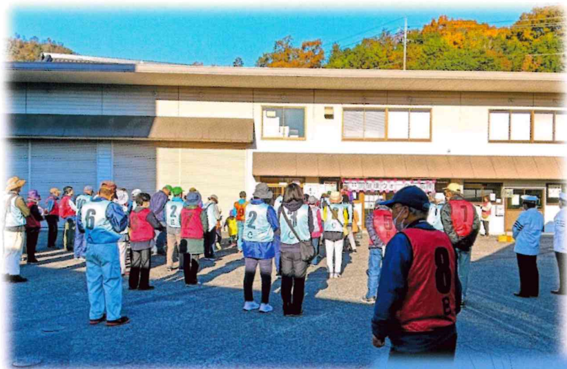
たくさんの参加者の皆さん

少し肌寒い朝。大人、子どもあわせて八十六名の方が社協事務所前に集まってくださいました。今年度は、市川方面のコースとなり、ナフコまで歩きました。天気にも恵まれ、談笑しながら楽しく歩く姿が見られました。