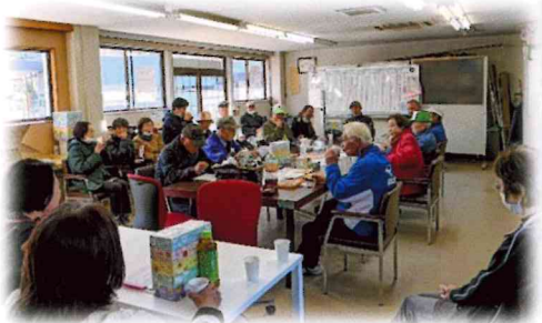
実行委員会の反省会