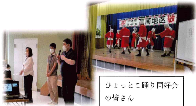
ひよっとこ踊り同好会の皆さん