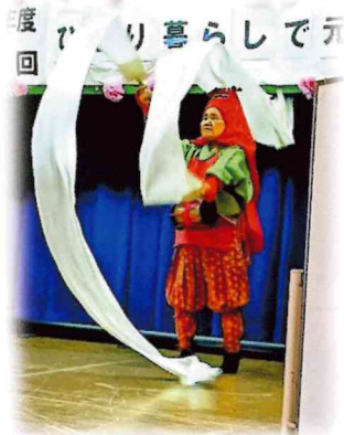
加計さんの越後獅子

十二月十四日、ひとり暮らしの高齢者にお集まりいただき、「ひとり暮らしで元気か〜い!」を開催しました。民児協、女性会、白木地域包括支援センター、若武者など、たくさんの方の助けを借りて楽しい会にすることができました。またこの度は、三味線やサクソ演奏もあり、素敵なお時間を過ごすことができました。来年度もぜひご参加ください。