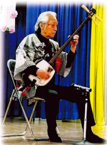
吉田茂さんの三味線♪