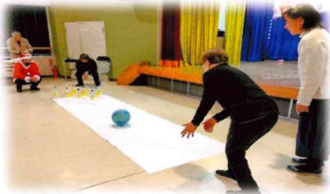
社協によるペットボトルボウリング