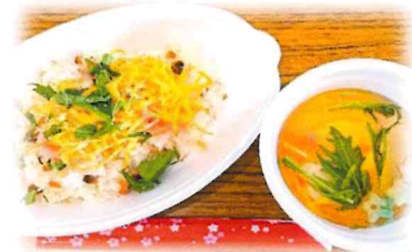
女性会による美味しい昼食