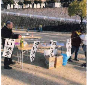
焚き上げる書初めの準備