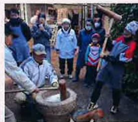
【よいしょ!よいしょ!】

令和6年12月22日(日)曇り空の中、町内の三世代38人が集まりお餅つきをしました。かけ声にあわせて杵をつきお餅ができました。あんこの上手な包み方を教えてもらいながら、あんこ餅・よもぎ餅を作りました。