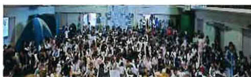
【おたのしみ大抽選会】