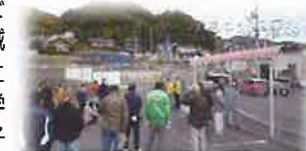
【ふれあいクリーン大作戦】