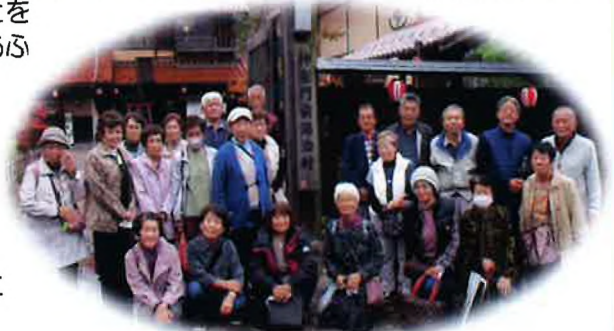
【楽しかったですよ♪ 皆さんも是非参加しませんか?】

まずは、温泉に入り、美味しい食事と笑い声の絶えない楽しい会話で宴会場が盛り上がりました。写真を撮る人、周りを散策する人、時間いっぱいまで楽しいひとときを過ごされていました。このような社協の行事を通して、感動を共有することにより、より一層地域の絆が深まったと実感しています。これからも、ひとりでも多くの会員の方に参加していただきたいです。