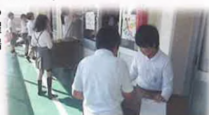
【上温っ子まつり準備の様子】

今後も子どもたちに役割があり、活躍することができる場面をたくさんつくっていきます。