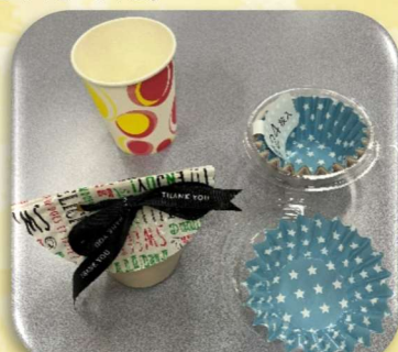
▲紙カップを縦に潰して、銀紙とリボンでお菓子入れ