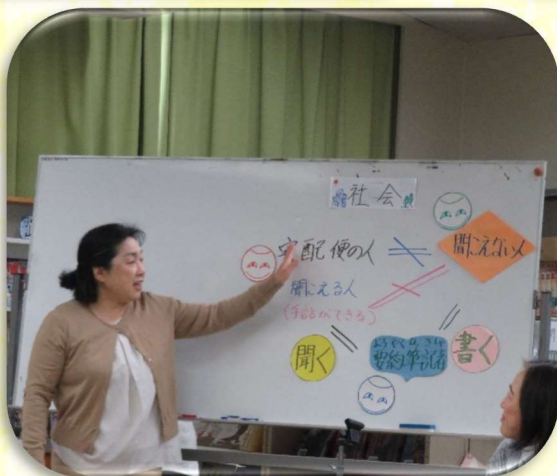
▲寸劇を見た後、聴こえる人と聴こえない人を繋ぐ、書いて伝える人のことを要約筆記者という事を、図にて説明を受けていました。