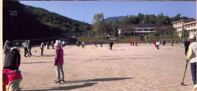
11月3日 安佐北区親善グラウンドゴルフ大会 250名の選手が参加