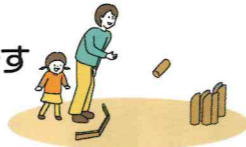
▼モルック大会の様子