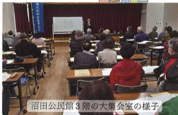
沼田公民館3階の大集会室の様子