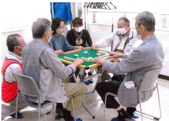
健康麻雀は2卓に増やして『リーチ』『ロン！』