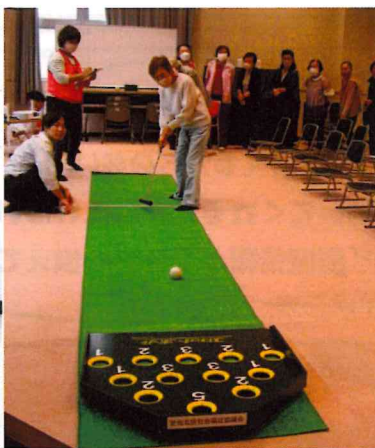
新ゲーム『スカットボール』