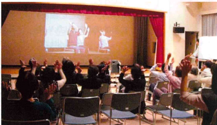
座ったままでできる『座・レクダンス』