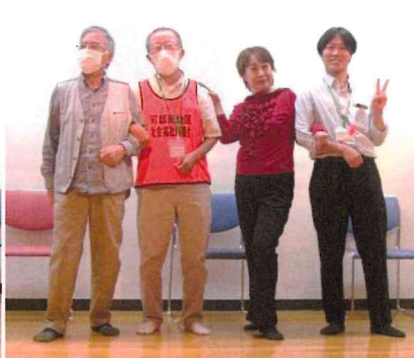
広ちゃん、紳ちゃん、康ちゃんの『飛び入りダンサー』たち