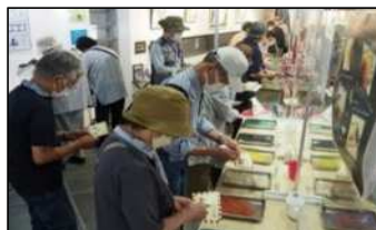
砂絵体験で カード作り

梅雨時期ということで、湿度が高く汗を滲(にじ)ませながらのバスツアーとなりましたが、珍しいもの、変わった風景を見たりあるいは触れることによって、非日常を体験し、身も心もリフレッシュするとともに、車内や観光地、お食事処などでは、友達同志の話が弾み、楽しい思い出の1ページが心に刻まれたのではないかと思います。