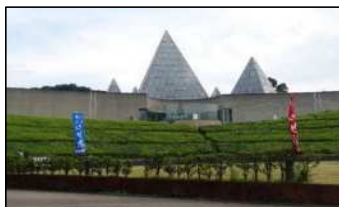
仁摩サンド ミュージアム

そこは大きなガラスの三角の屋根が特徴で、世界最大の砂時計の説明を受けるとともに、鳴り砂の実験や砂絵作りなどをして楽しいひと時を過ごしました。