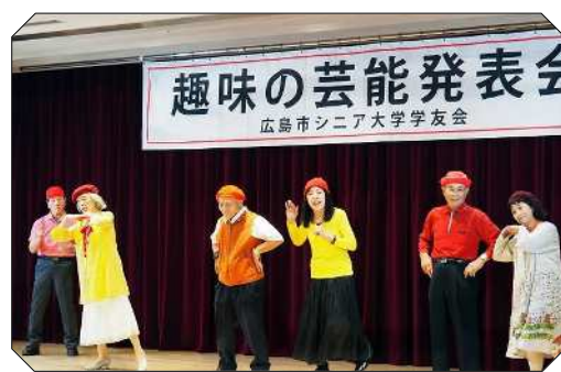
趣味の芸能発表会 プログラム番号⑩ おしばいとダンス より