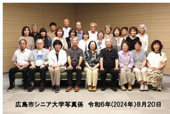
広島市シニア大学写真係 令和6年(2024年)8月20日

◎写真係は、撮影班と撮影以外のすべてを扱うマネジメント班に分かれて、学園祭当日は対応します。撮影班はステージ、ホールCでの集合写真、各ブースや作品展示の撮影などマネジメント班はステージからホールCまでの誘導、集合写真のマネジメントを行います。これらの写真から各班、各サークル等のアルバムを制作します。写真選定には各代表者の意見も反映します。素敵なアルバムができるよう努めますので、お買い上げをよろしくお願いいたします。