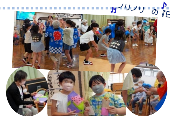
千歳園のおいしいちゃん おばあちゃんから 折り紙としおり の贈り物

2024年8月20日 千歳園でも 山田音頭 山田小学校の子どもたちと 山田音頭保存会のみなさん