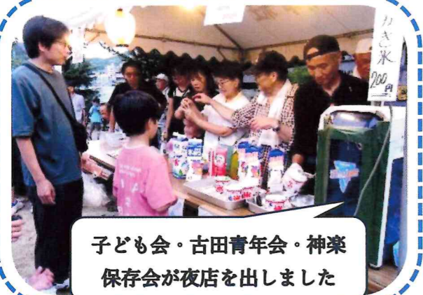
子ども会・古田青年会・神楽保存会が夜店を出しました