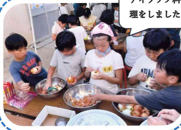
アイラップ料理をしました