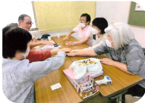
「7ならべ」で大いに盛り上がりました