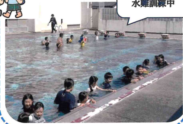
ただいま、水難訓練中

災害発生時、避難所指定される小学校体育館での宿泊研修に、地域の多くの皆さんに参加していただき、普段経験できない避難所での生活を体験し、万が一に備え、衣・食・住の「住」も重要であることに気付いて欲しいと思います。