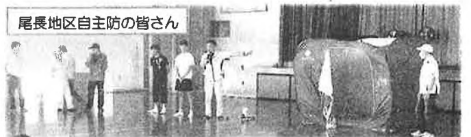
尾長地区自主防の皆さん

この度の子ども会行事は、予定通りに進行する事が出来ませんでした。色々ご準備頂きました諸団体の皆さまに、この場をおかりしてお礼申し上げます。本当にありがとうございました。