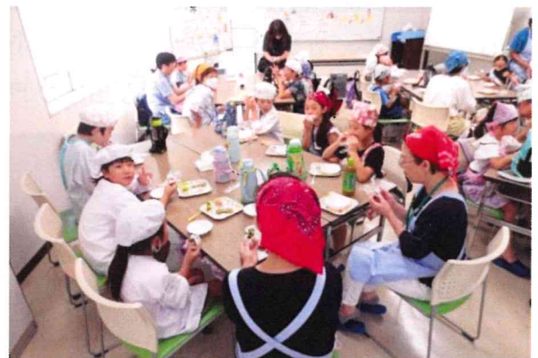
みんなで楽しく試食タイム

この行事は、広島市可部福祉センター、可部公民館、可部南地区社会福祉協議会が共催しました。