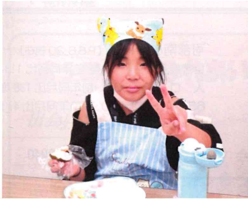
「自分で作ったおにぎりはおいしいよ！」