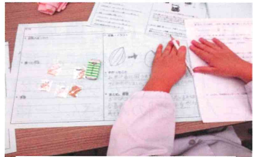
習ったことをしっかりメモ 「これで自由研究ができたよ」