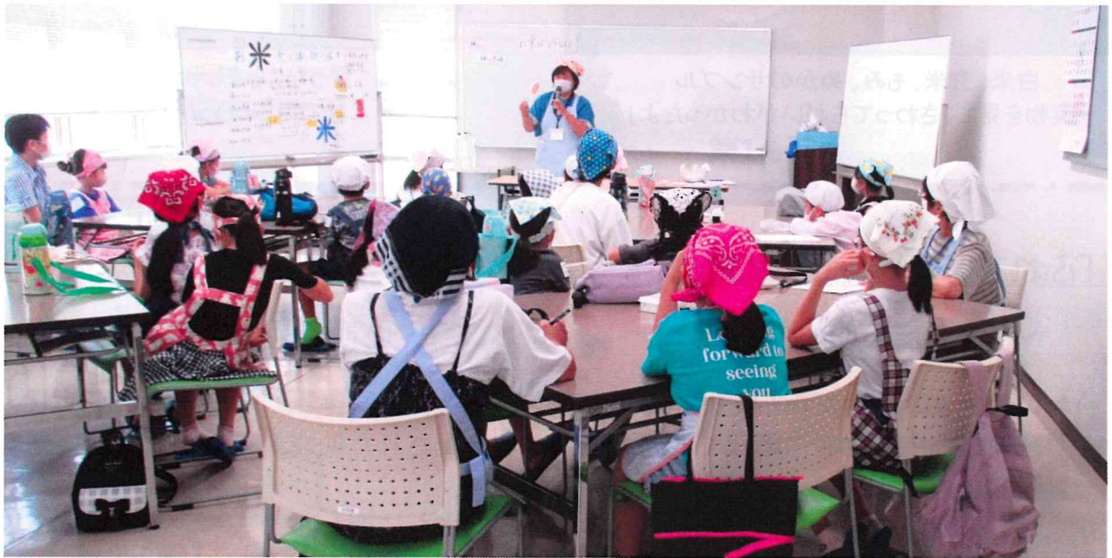
お米ができるまでをみんなで勉強。「八十八の手間をかけるんだよ」

8月9日（金）9時30分から可部福祉センターを会場に行ないました。 主役は小学一年生から六年生21名のみなさん。準備や進行のお手伝いをする社協の『エプロン隊』のみなさんと一緒に楽しく学びました。