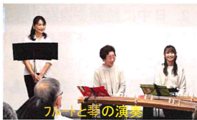
フルトと琴の演奏