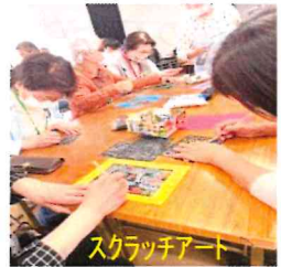
スクラッチアート