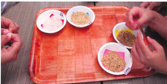
白米、玄米、もみ、ぬかのサンプル 「実物を見て、さわってちがいがわかったよ」