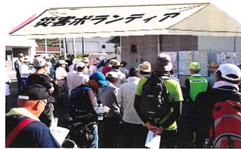
作業開始前の全体ミーティング