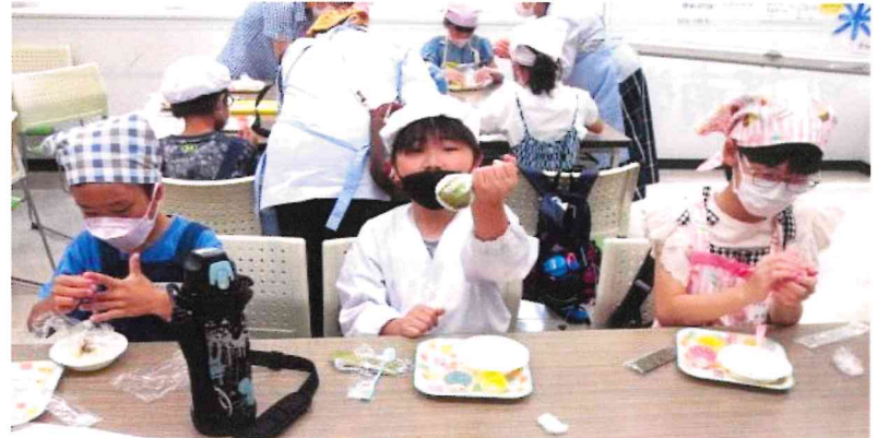
「おむすび出来たー」「俺んちは 100%コシヒカリ △□○※」