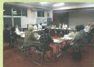
公園等整備に係る広島市との協議