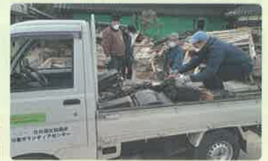
実際の災害ボランティア活動