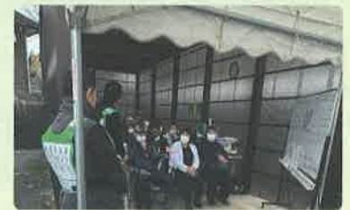
災害ボランティア活動説明の様子