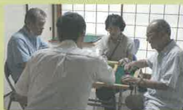
麻雀サロンの様子

単身の方も気軽に来ていただける麻雀やカラオケのサロンを始められています。百歳体操もやっていますので、気軽にお立ち寄りください。