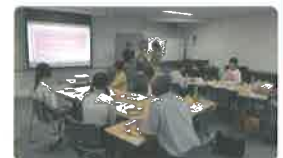
ボランティア体験談で盛り上がりました！

人が集まる場での楽しいあそびネタや雰囲気づくりのノウハウ、ボランティアを始めたきっかけやどんな活動をしているか等を学びました。