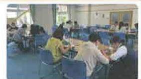
笑顔がいっぱい！スマホ講座

大町のびのびサロンと古市学区社会福祉協議会の方にご協力いただき、開催しました。学生ボランティアと参加者の方の間では、楽しそうに教え、語り合う場面がたくさん見られ、温かみのあるほっこりとした時間になりました。