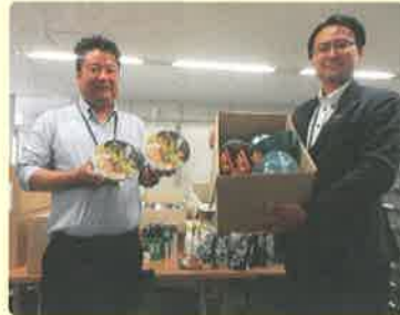
たくさんの寄贈をいただきました！

※セブン-イレブン・ジャパン様、広島市、広島市社会福祉協議会では、商品寄贈による「社会福祉貢献活動に関する協定」を令和5年3月に締結しました。