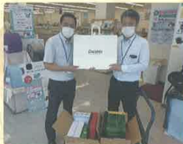
お菓子等の寄贈をありがとうございました！