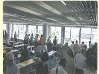
学(地)区社協による地域活動の一助となっています！