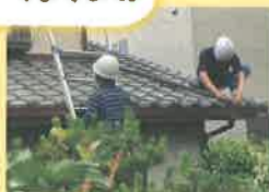
生活支援訪問サービス