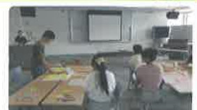
ボランティアへの意欲が高まりました！

第2回を振り返り、「今後やってみたいボランティア」について、好きなことや得意なことをグループで話し合いました。また、様々なボランティアの紹介を行いました。