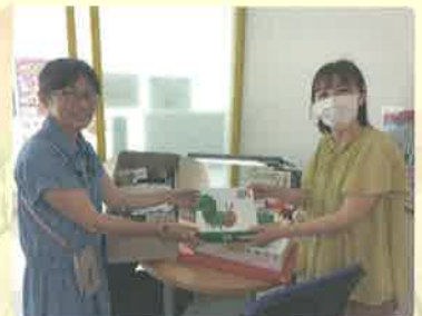
地域の子ども食堂へお渡ししました！