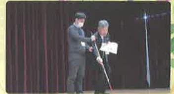
研修会での講師による白杖説明

ご関心をもたれた方、ご協力をいただける方はぜひ区社会福祉協議会までご連絡をお待ちしております。