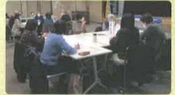
グループワークの様子が皆さんで話し合います