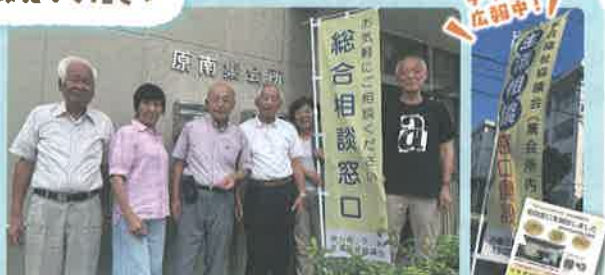
相談窓口スタッフ