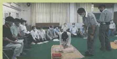
防災訓練の一コマ