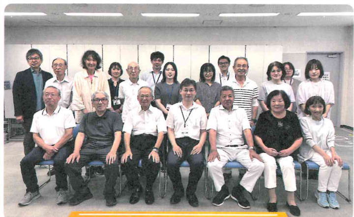
西区の拠点スタッフの皆さん他

西区で拠点活性化支援事業に取り組む地域の皆さんで交流会を開催しました。西区と他区の取り組み状況について知り、改めて地域の皆さんに気軽に立ち寄ってもらえる拠点にするにはどうしたらよいか学びました。