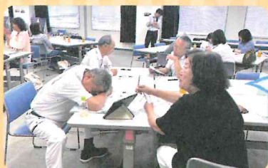
関心を示さない 態度で相談対応の ロールプレイ中

また、2人1組で相談対応のロールプレイを実施しました。活動拠点へ相談に来られた方にどのような対応をするのがよいのか、改めて考える機会となりました。