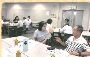
お互いの地区で 情報交換