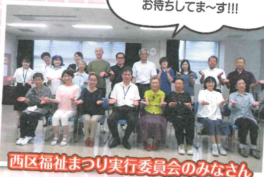
西区福祉まつり実行委員会のみなさん