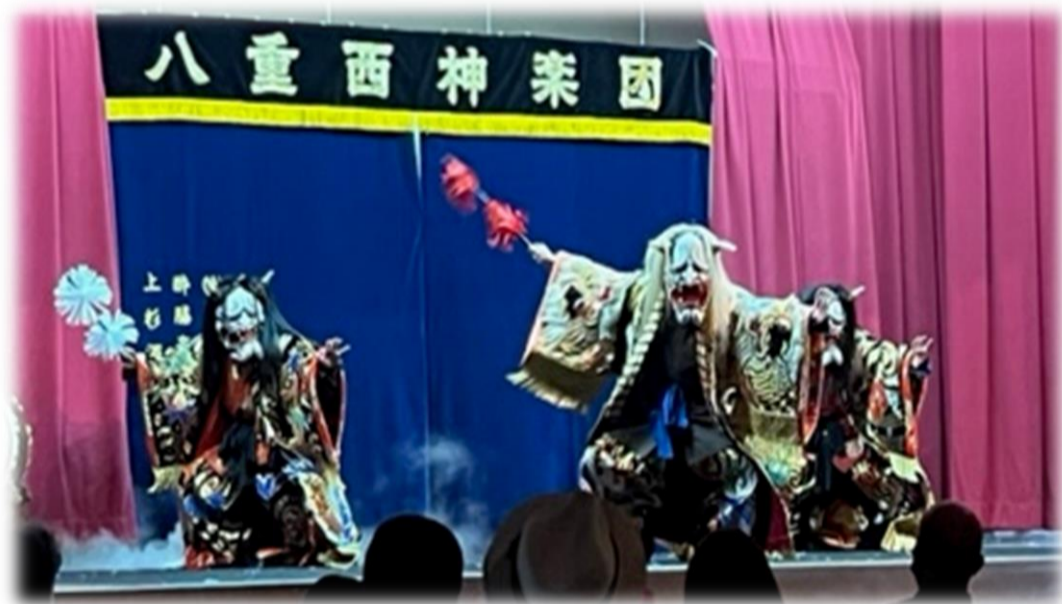
「第1回 すずがみね文化のつどい」演目「土蜘蛛」

この秋も、鈴が峰地区社会福祉協議会・チームアップ鈴が峰主催で「すずがみね文化のつどい」を実施します！