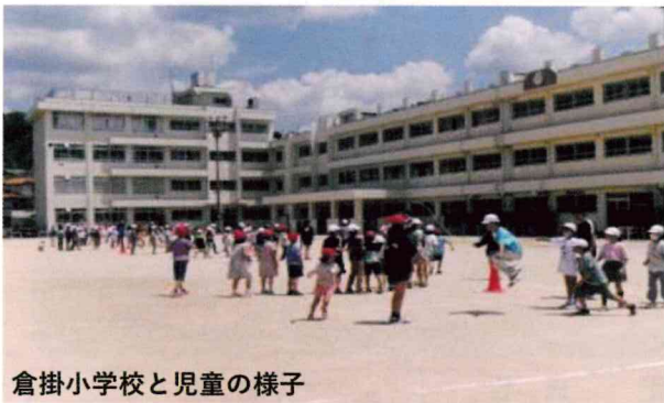
倉掛小学校と児童の様子