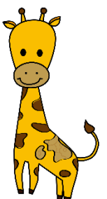
安芸区社協 マスコット キャラクター あきりん