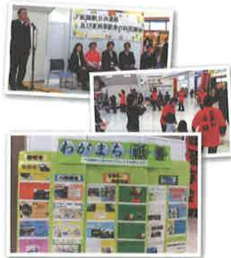
4年生による学習成果の展示