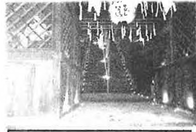
尾長天満宮の「平和」の文字