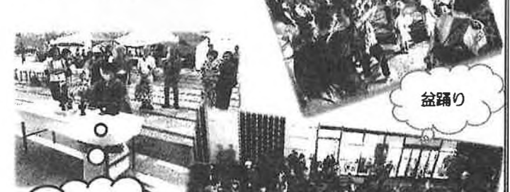
今年は盆法要も行いました。