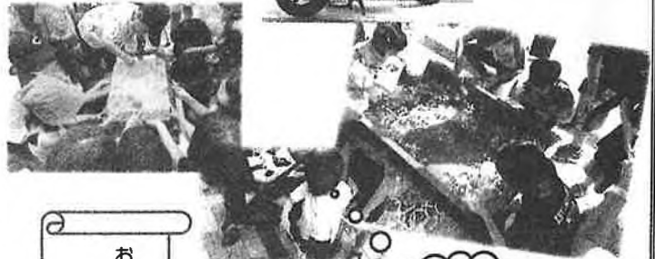
おながフェスタの様子