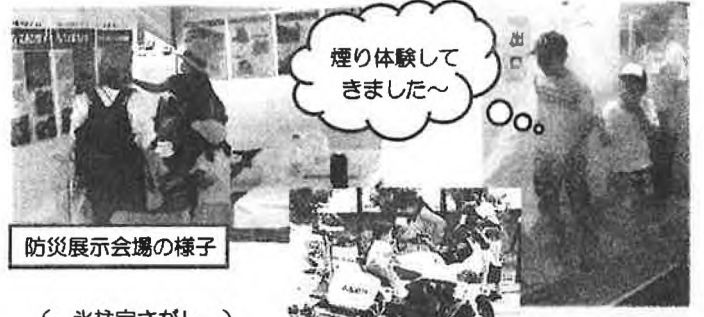
防災展示会場の様子