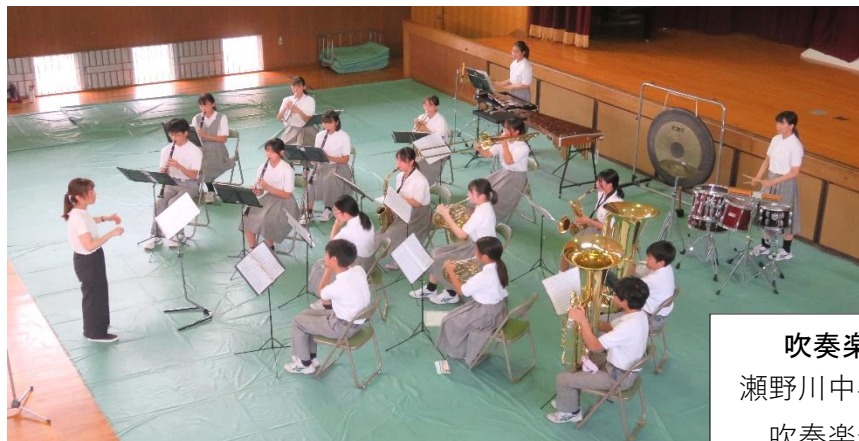
吹奏楽 瀬野川中学校 吹奏楽部