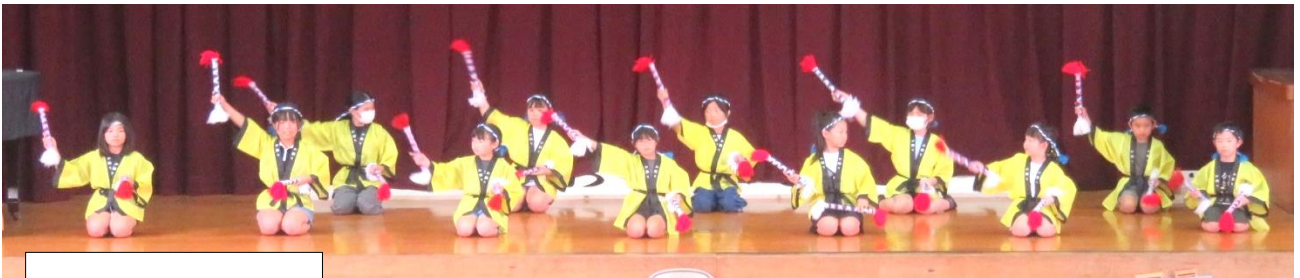
銭太鼓 中野児童館