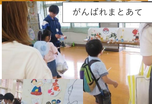
がんばれまとあて