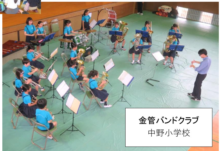
金管バンドクラブ 中野小学校

オープニングセレモニーの後、ゲームやお化け屋敷、スポーツを楽しんで、カレーなどに舌鼓を打ちました。