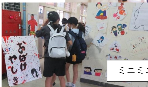
ミニミニおばけやしき