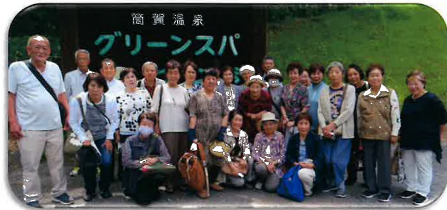
(たのしくおしゃべりしたよ)

6月21日、曇り空の中参加者26名を乗せたバスは「グリーンスパつが」に向かいました。車窓からは安芸太田町の自然が広がり、久しぶりに会った人たちとの会話が弾みました。到着後、お風呂に入る人や自然を満喫する人と色々でした。会食では自己紹介、そして乾杯、美味しい食事、途中からはカラオケタイムと楽しいひと時を過ごしました。集合記念撮影後帰路につき、途中道の駅で買い物を楽しみました。