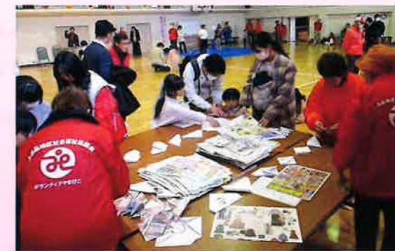
【みんなで楽しく遊びました♪】

3月25日(日)ちびっこ桜まつりを開催しました。あいにくの雨でしたが、昔遊びやふるさとカルタ取りで、たくさんの子どもの元気な声が聞こえてきました。