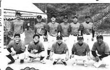
福木体協ソフトボール部

私たちは、春と秋の年2回ソフトボール大会を開催しています。この大会は、ケガなく楽しい一日になることを目的としていますので、野球やソフト経験者もそうでない方も大歓迎。人見知りの方もフォローさせていただきます。 次回は10月6日(日)に福木中学校での開催予定です。時期が近付きましたらソフトボール部より町内会回覧で大会参加者募集のお知らせをします。選手の参加条件は、福木学区の中学生以上の方。