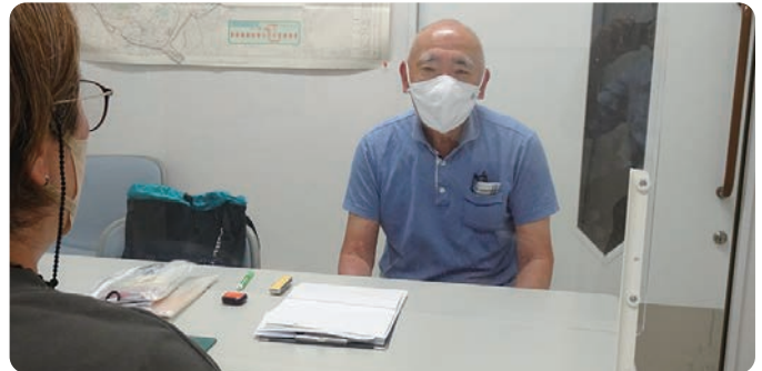
今日の支援内容を確認しています