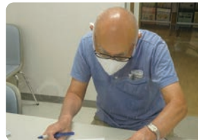
支援内容報告をしています