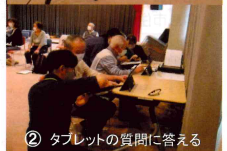
② タブレットの質問に答える