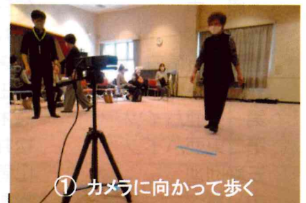
① カメラに向かって歩く