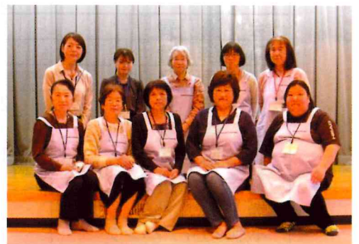
私たちが見守っています