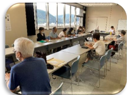
点字サークルてんとうむし