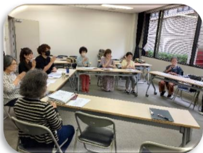
手話サークル高陽