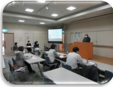
NPO 法人 広島市要約筆記サークル おりづる安佐北支部