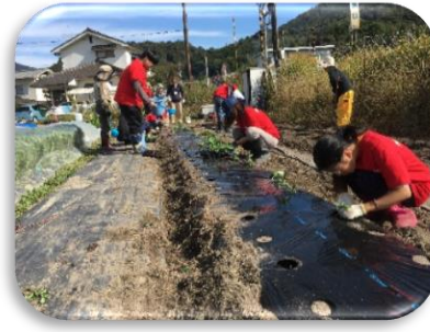
NPO 法人 My Life もぎもぎ☆ふあーむ