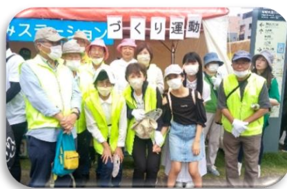
明るい社会づくり運動 高陽協議会