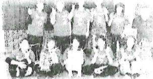
優勝の八幡学区バレーボールチーム

「第40回佐伯区民スポーツ大会」(5月19日開催)結果バレーボールの部で八幡チームが優勝!!ソフトバレーボールの部で八幡Aチームが2位。ほか、ソフトボール、グラウンドゴルフ、バドミントン、パタンクが出演し健闘。スポーツを通して参加者同士のコミュニティも深まり有意義な大会になりました。