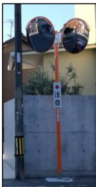
左右の確認の難しい交差点へカーブミラーを設置