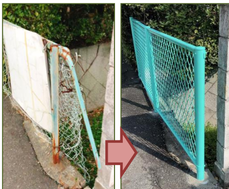
古く危険なフェンスの取替え