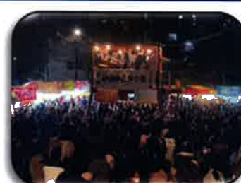
豆撒きを楽しむ参拝者達