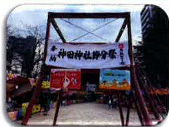
豆撒きをするやぐら