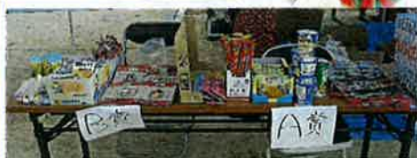
ゲーム何点だった?