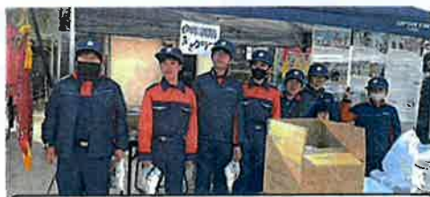
少年消防クラブ:非常食の提供