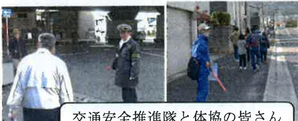
交通安全推進隊と体協の皆さん コース警備ご苦労様でした。