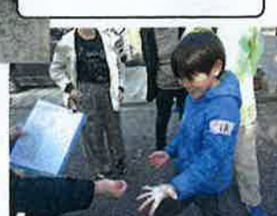
公園では じゃんけんゲーム