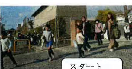
スタート ダッシュ!