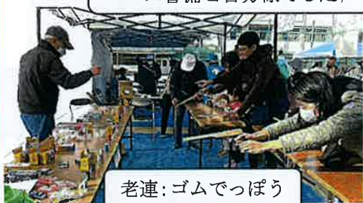
老連:ゴムでっぼう