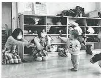
「これあげる」「これくれるの」 スタッフ(民生委員)との優しい 会話に思わずニコリ