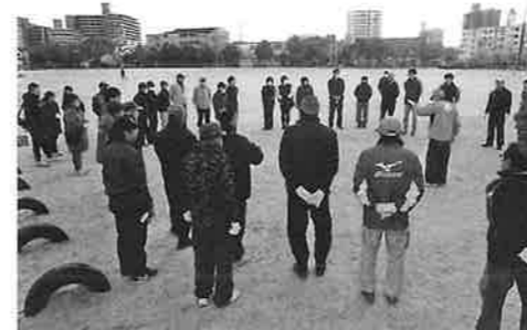
準備の方々は10時に集合