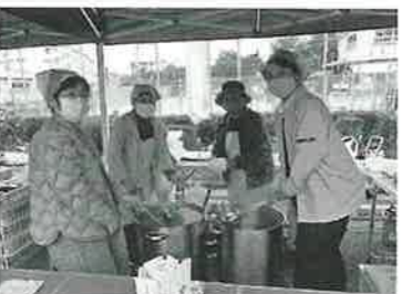
アツアツのうどん、いかが?