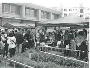
大勢の人たちで賑わう