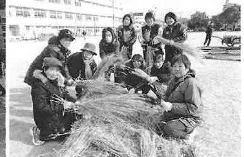
お手伝いの女性軍は藁を束ねる