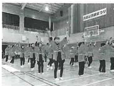
開幕にひと花「好きじゃけん! よしじま」

第48回吉島公民館まつりは、令和5年11月11日(土)12日(日)の両日盛大に行われました。コロナ明けということもあり、元通りに運営され賑やかさが戻りました。