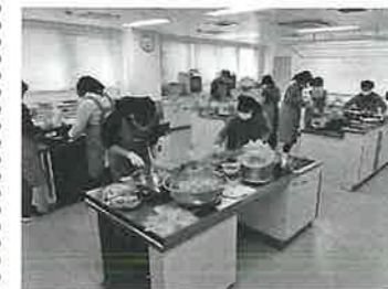
スタッフ総出で準備中