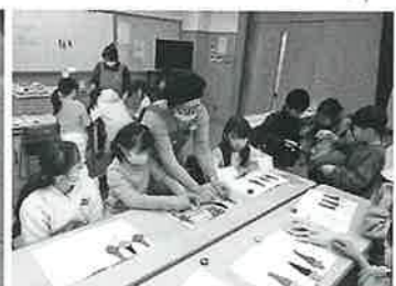
毎回楽しい工作もやっています

皆様、子ども食堂をご存じですか?毎月1回(第4土曜日)のお昼、吉島公民館にて小学生の皆さんに手作りのランチを提供しています。主に民生委員とそのOBが心を込めて作っています。材料は近隣のお店などにもご協力いただいています。子ども達の「おいしかったです。」「ごちそうさまでした。」の言葉を励みに、これからも続けていきたいと思えます。