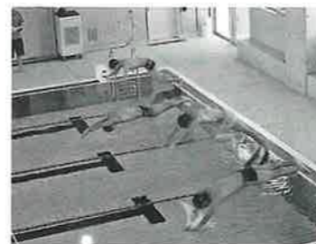
オープニングでは水泳の実技が行われた