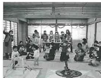
令和5年12月11日 クリスマス会&お誕生日会 ハンドベルの演奏あり、クリスマスプレゼントあり、お誕生日プレゼントあり、笑顔いっぱい