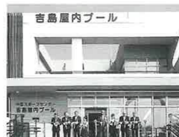
吉島屋内プール開館記念式