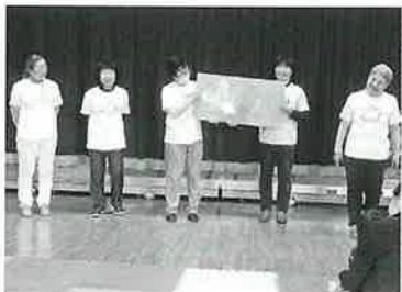
おはなしエルマーさんの紙芝居