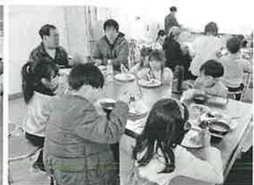
教頭先生もご来店