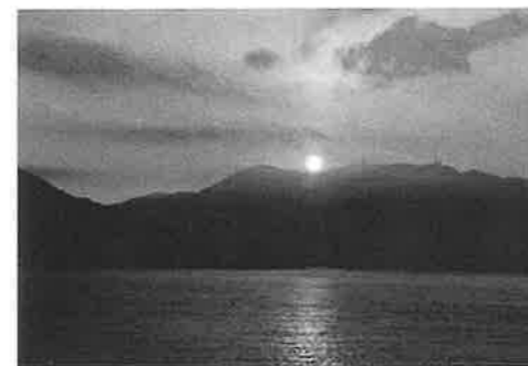
令和6年新年の夜明け