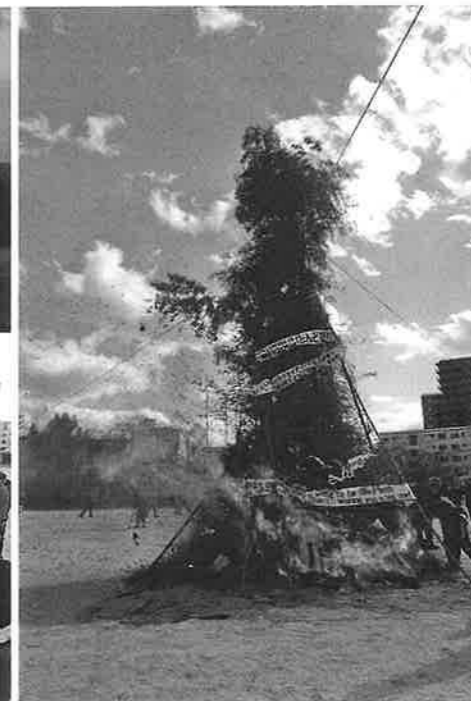
とんどの火は勢いよく燃え上がる