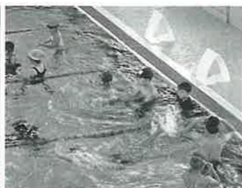
子どもたちの歓声が響く

幼児から高齢者まで、水泳、体操、軽運動を楽しめる吉島屋内プールが移設オープンしました。プールでは、水深を変えられる可動式床を備え、多目的室では健康体操、ヨガなどの活動ができます。温水は中工場から出る熱を利用しています。吉島の住民は割引の利用料の特典もあるので楽しみながら健康づくりに、大いに利用しましょう。