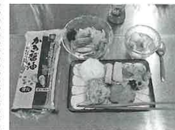
ある日のランチメニュー