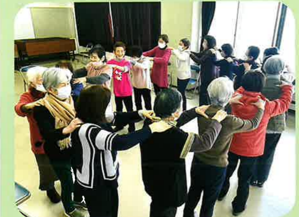
1月24日(水) スマイル(百歳)体操クラブ 毎週水 竹屋公民館 9:45～