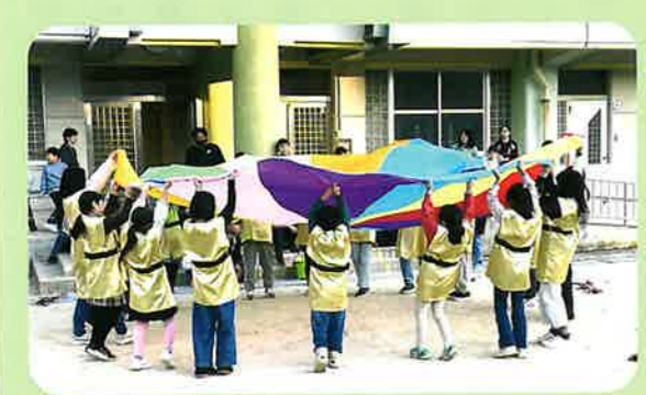
1月14日(日) 世代交流とんどまつり 演舞