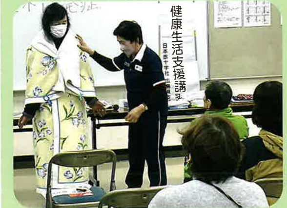
2月22日(木) 社協・民児協合同研修会 両手を自由にするために毛布でガウンを作る