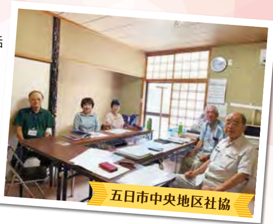
五日市中央地区社協

地域に住む誰もが憩い、つながりを深め、安心して暮らせる地域づくりのための大切な場所です。 よろしかったら、ちょっと、よってみませんか。 きっと、温かくお迎えしていただけると思います。