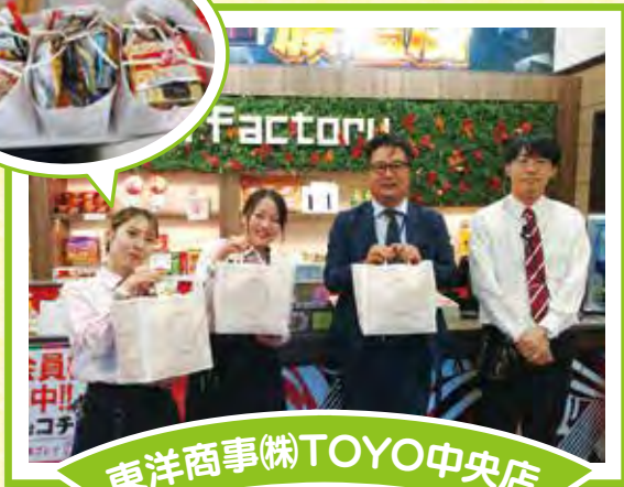
東洋商事(株)TOYO中央店