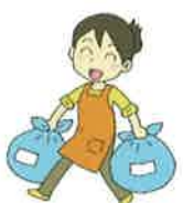
ゴミ出しのお手伝い