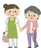
買い物や病院の付き添い