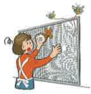
網戸や簡単な屋外補修