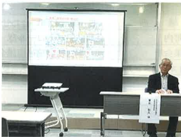
青木氏とグループ討議中の参加者さん

このマークは、社会福祉協議会のシンボルマークです。安北学区社会福祉協議会旗にも使われています。