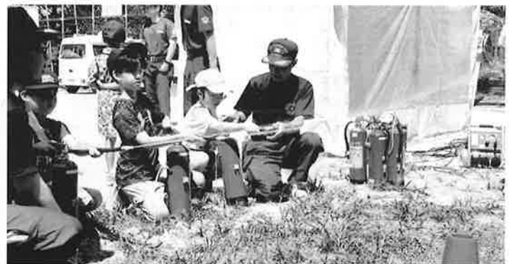
水消火器を使っての放水（消火）体験。うまく的に当たったかな？