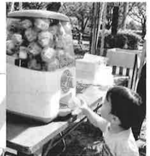
スタンプラリーを終えた子どもたちは、ガチャを回して景品を手に入れました。