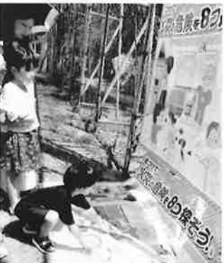
防災クイズに挑戦！ 8問全問正解できたかな？