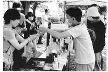
もみじ作業所のかき氷は、ほてった体を芯から冷やしてくれました。