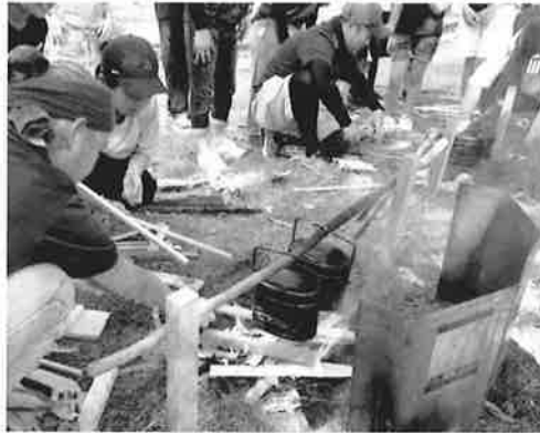
体協は子どもたちと一緒に飯ごう炊さん。どの飯ごうも「きれいに」「おいしく」炊き上がりました。