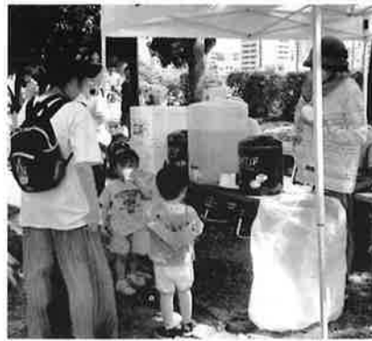
老連の冷茶サービス。熱中症予防にひと役かう「オアシス」です。

設計は完了も、工事は延期 中島集会所 移転・新築の進捗 令和6年度に移転・新築予定(現集会所解体も含む)の中島集会所については、中島地区社協・各町内からの要望も多く取り入れられた設計が完了し、工事の着工を待つばかりでした。しかし、本年8月の工事の入札では予定価格を満たす業者が無く、改めて令和6年度初旬までに入札、同年8月頃着工、同年度内に移転・新築完了予定に延期となりました。(入札の状況でさらに変更の可能性あり)早期の完成を心待ちにしましょう。(中島地区社協 事務局)