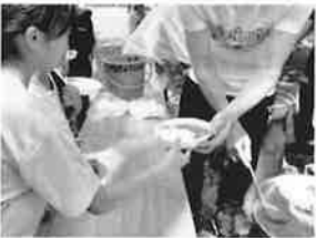
皆さんの協力で出来上がったカレー。いただきませす！