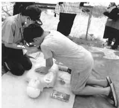
AED（自動体外式除細動器）を使っての心肺蘇生体験。みんな一生懸命でした。