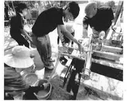
給水車からの水は飯ごう炊さん、カレー作り、冷茶サービスにも使いました。