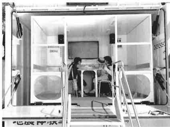
起震車で地震体験。子どもたちの叫び声も聞こえました。