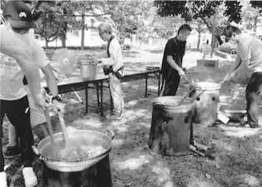
暑い中、火を使うカレーの調理は大変です。子ども会や刑務官の有志の皆さん、ありがとうございました