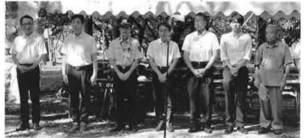
来賓の皆様、暑い中、早朝からのご参列、誠にありがとうございました。