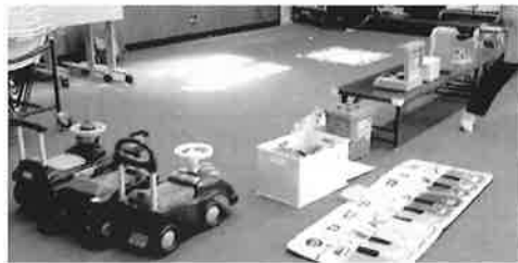
防災フェスタと同時に、民児協は集会所で子育てサロンを開催しました。

慢性的な交通混雑の緩和、交通事故の削減、沿道環境の改善が目的 国道2号線西広島バイパス延伸事業の設計説明会を開催 国土交通省では、国道2号線の慢性な交通混雑の緩和、交通事故の削減、沿道環境の改善などを目的に、「一般国道2号線西広島バイパス都心部延伸」事業を進めています。そして、令和2年度から未整備区間の中区平野町、西区観音本町区間での事業を再開し、設計を進めています。 この区間に含まれる加古町、住吉町の全住民には書面で通知されていますが、広く中島地区の住民を対象とした設計説明会が次の日程で開催されますので、