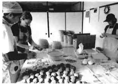
カレーに使う野菜の下処理は、衛生面への配慮のため、集会所内で行いました。