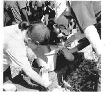
飯ごうでのお米とぎ。上手に水を切りました。