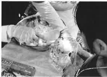
飯ごう炊さんをした子どもたちは、炊いたご飯でおにぎりを作って食べました。