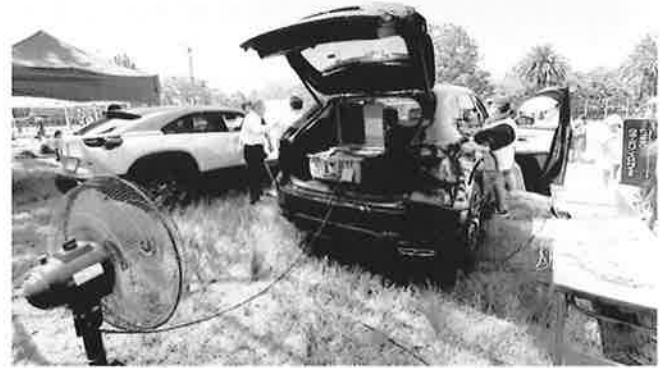
停電が起きた際にも、マツダPHEVからの電力供給によって、扇風機やスマホの充電などができることも紹介されました。

慢性的な交通混雑の緩和、交通事故の削減、沿道環境の改善が目的 国道2号線西広島バイパス延伸事業の設計説明会を開催 国土交通省では、国道2号線の慢性な交通混雑の緩和、交通事故の削減、沿道環境の改善などを目的に、「一般国道2号線西広島バイパス都心部延伸」事業を進めています。そして、令和2年度から未整備区間の中区平野町、西区観音本町区間での事業を再開し、設計を進めています。 この区間に含まれる加古町、住吉町の全住民には書面で通知されていますが、広く中島地区の住民を対象とした設計説明会が次の日程で開催されますので、