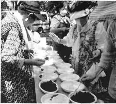
女性会は大釜でお米を炊き、カレーの配膳のお話もしました。