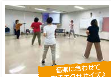
音楽に合わせて 空手エクササイズ!