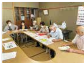
様々な機関の情報紙を見ながら、 来所者とお話中

開設時間 毎週月曜日: 10:00-12:00 毎週木曜日: 14:00-16:00