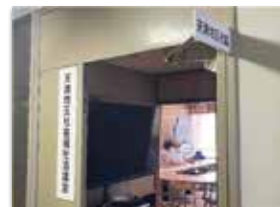
中広会館1階にある 天満地区社協活動拠点

地域住民であれば、 どなたでも来ることができます。 ぜひ、お近くに来られた際は、 気軽に立ち寄ってみてください!!