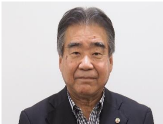
大学院 OB 会会長 挨拶