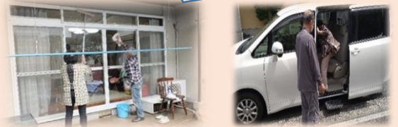
令和3年度は35団体が実施されています！