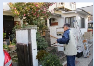
庭木の剪定作業の様子です。