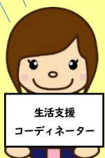
生活支援 コーディネーター

通いの場等、地域活動においては、様々な理由で悩まれることも多いと思います。そんな時は抱え込まず、気軽に区社協の生活支援コーディネーターまで声をかけていただけると嬉しいです。