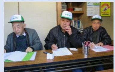
ボランティアコーディネーターの方々です。

今日に至るまでには、何度も地区社協や地域包括支援センター、南区社協も一緒に会議を持って準備を進めてきました。地域の方々が「地域のために何かできることはないか」と一緒に考えてくださり、共感が広がっていったことが何よりの活動の原動力となり、順調に活動しています。