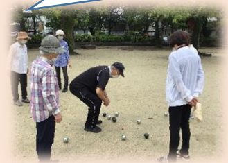
公園でベタンク！元気に介護予防！！