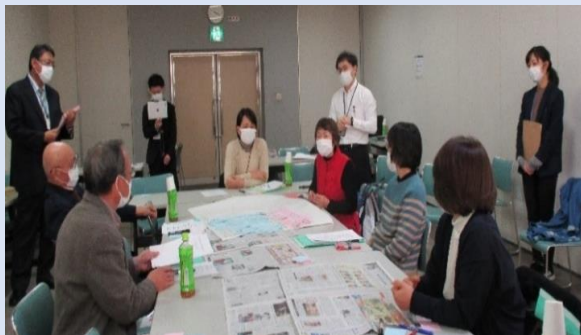
「楽しくやろう!!」が基本です。

今年度は、何とか形あるもの、目に見えるものを作ることを目標に、形式にはこだわらず、協議体の活動の活性化に結びつくようなサロンの視察や認知症VR体験会など、幅広く企画しています。