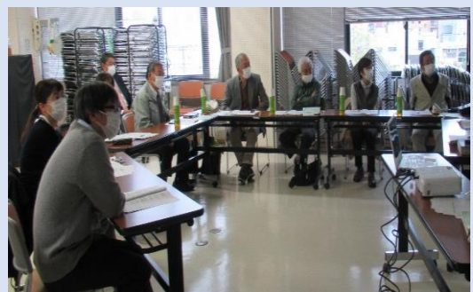
「協議体って・・・？」振り返りをしています。