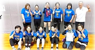
第3位の八幡学区バレーボールチーム

「第39回佐伯区民スポーツ大会」(5月21日開催)において、八幡学区からはバレーボールとバドミントンのチームがそれぞれ第3位！おめでとうございます！ほか、ソフトボール、ソフトバレーボール、卓球、グラウンドゴルフ、ペタンクが出場し健闘。上位には入れなくとも参加者みんな楽しい一日になったとのこと。各会場では熱戦が繰り広げられるとともに、スポーツを通して参加者同士のコミュニティも深まり有意義な大会になりました。これがスポーツの醍醐味です。