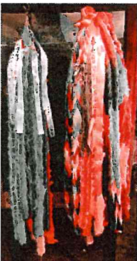
千羽鶴奉納 鈴張小学校 仏教婦人会