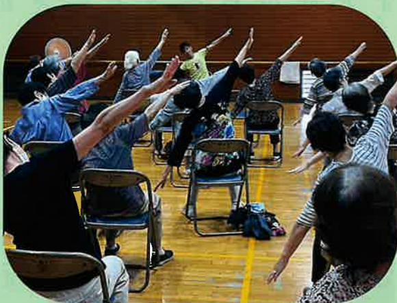
スマイル体操 公民館 毎週水曜日 9時45分～10時30分