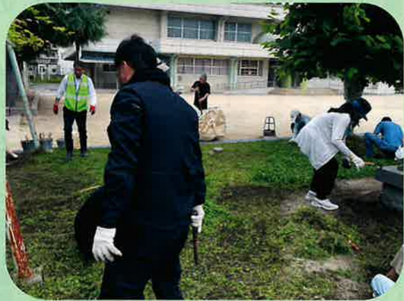
令和5年6月13日(火) 竹屋小学校美化活動