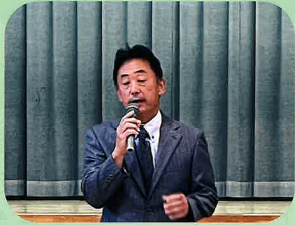
令和5年6月12日(月) 竹屋地区社会福祉協議会総会