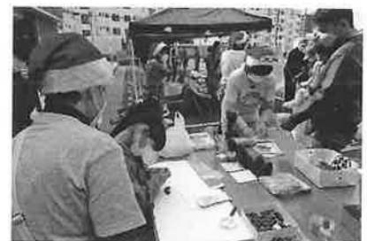
お話しエルマーさんのコーナー