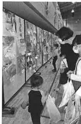
子どもたちの絵の展示