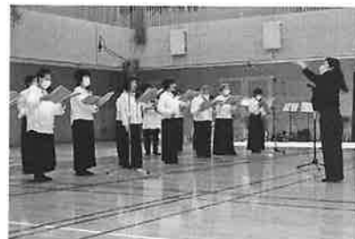
サングレースの演奏

コロナ禍のため、吉島体育館ではステージ発表、公民館駐車場では体験コーナー（お話しエルマーさん、吉島プール職員さん）だけの文化祭となった。子どもたちの絵の展覧会には、たくさんの方が鑑賞されていた。