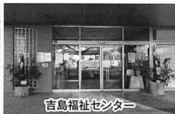
吉島福祉センター