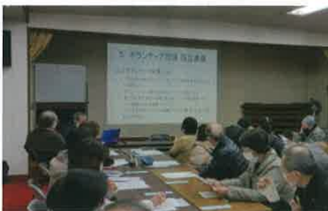
真剣に聞き入る受講者

福祉のまちづくりプラン推進部会では1月20日、広島市で注目されている、「(協同労働)タウン・サポート平和台」の活動について、安西学区の町内会・自治会長や民生委員を対象に研修会を開催しました。