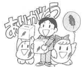
◎戸別募金 (敬称略、単位、円)

赤い羽根共同募金につきまして、平素より格別のご理解とご協力を賜り、おかげをもちまして久地南地区から 595,340円の募金実績をあげることができました。(12月31日現在) これもひとえに各自治会長様をはじめ、法人・個人と多くの方々のご支援のおかげと厚くお礼申し上げます。共同募金は、障害者施設、社会福祉施設の費用や当地区社協の福祉活動にも使われています。