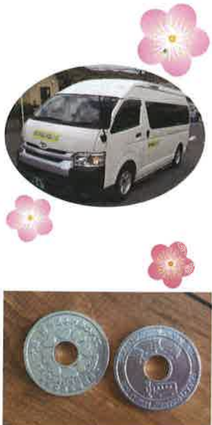
↑コイン式乗車券の表面と裏面