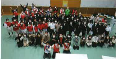
↑最後に全員で集合写真を撮影