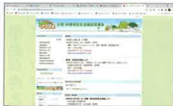
↑社協ホームページ

上記講座の内容は、大塚・伴南学区社会福祉協議会のホームページにも掲載しています。当日参加できなかった方もインターネット環境があれば、動画を観ることが出来ます。ご興味のある方は、ホームページを訪問してみてください。